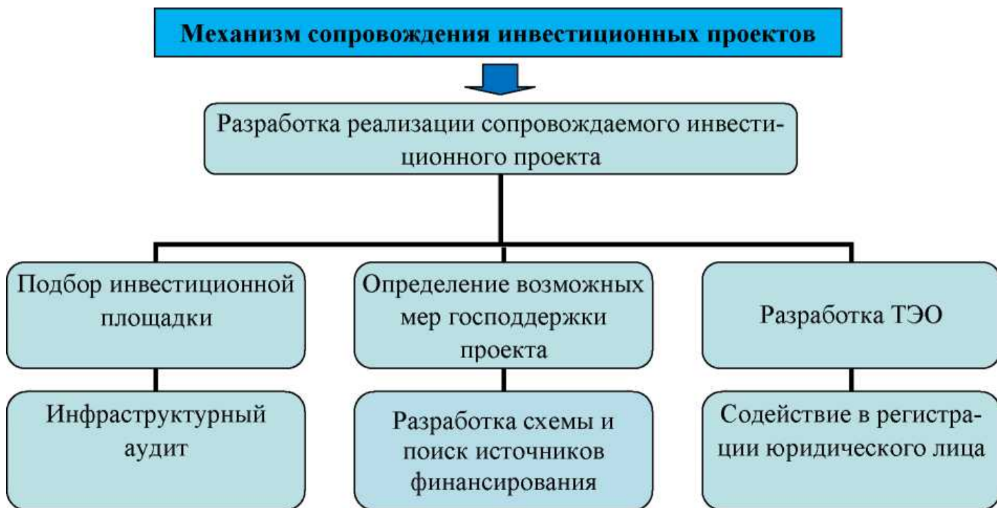
Рисунок 2 - Механизм сопровождения инвестиционных проектов